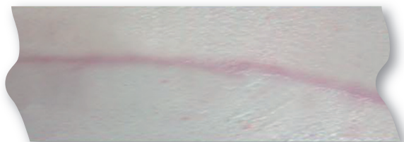
Resultat nach 3-monatiger Behandlung