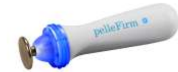
30 mm PelleFirm