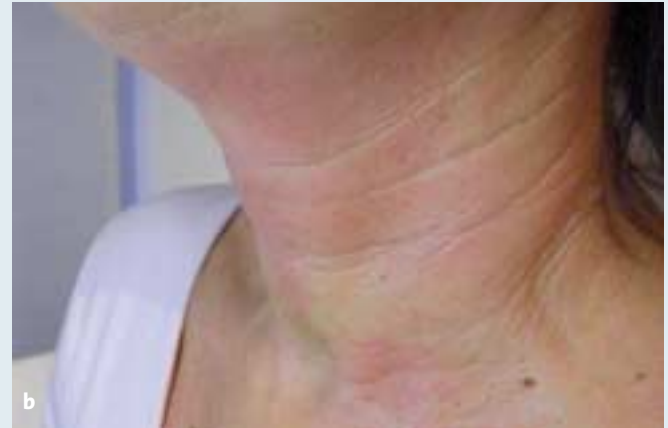
Abb 1: Patienten mit starker Faltenbildung im Halsbereich: Befund vor und nach der Radiofrequenz-Behandlung